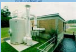
מערכת ניטרול גז כלור

מערכות לסינון וטיהור אוויר, סילוק גזים, VOC, עשן וריחות