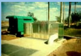
מערכת לניטרול ריחות